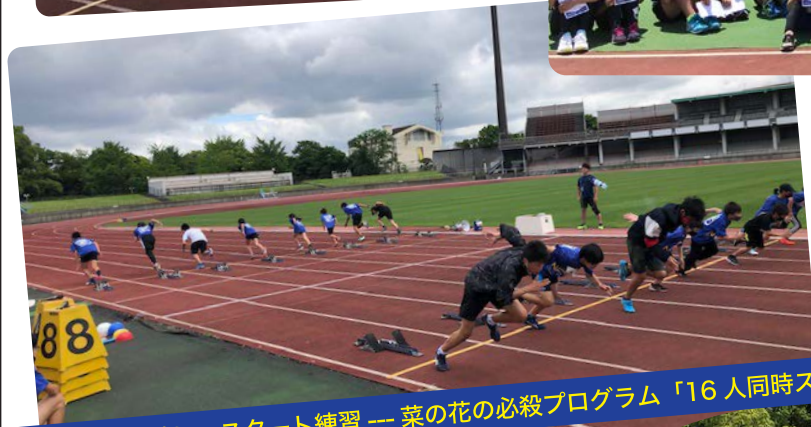
競技を始める前に、スタート練習 --- 菜の花の必殺プログラム「16人同時スタート」